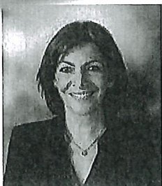
Anne Hidalgo Maire de Paris